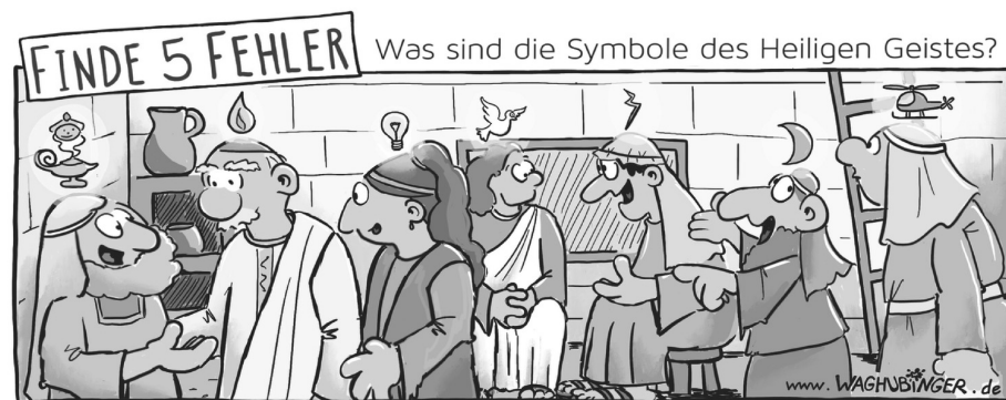
Flaschengeist, Glühbirne, Blitz, Mond, Hubschrauber

Und was ist der Heilige Geist? Oft wird er mit einer Taube dargestellt. Die Bibel redet von Feuer als Bild für den Heiligen Geist. Doch was ist er? Gut könnt ihr das am Wirken des Geistes erkennen: Die Jünger hatten Angst, doch nach Pfingsten waren sie mutig und verkündeten den Glauben an Jesus. Vorher waren sie traurig, doch dann waren sie fröhlich, weil sie spürten, Jesus ist noch bei ihnen. Und so wirkt der Heilige Geist auch noch heute. Er ist die Kraft, die Gott uns für das Leben schenkt: Wenn wir ängstlich sind und Sorgen haben, wenn wir einsam sind und uns alleine fühlen, wenn wir traurig sind. Dann hilft uns Gott durch den Heiligen Geist. Er ist die Kraft seiner Liebe.