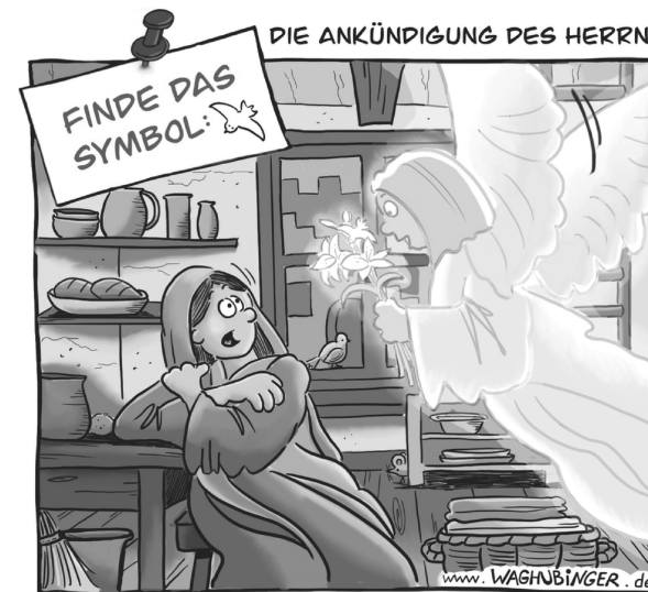
Lösung: Die Taube verbringt sich im Lilienstrauß des Engels.

von dem Engel verkündigt wird. Eigentlich ganz klar. Auf dem Bild seht ihr, dass der Engel Blumen in der Hand hält. Nicht, weil man bei einem Besuch Blumen mitbringt, sondern diese Blumen sind Lilien, ein Symbol dafür, dass Maria von Gott erwählt wurde.